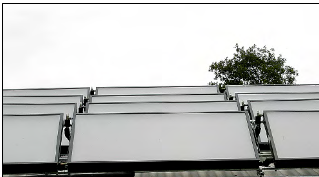
Solarthermie zur Aufbereitung von Warmwasser und zur Unterstützung der Heizung

anlagen mit insgesamt etwa 50 kWp installiert. „Unser Betrieb wird von unseren Kunden und Verbrauchern als Gesamtheit wahrgenommen. Zu der tiergerechten Hühnerhaltung passt auch gut das Image einer Fotovoltaikanlage.“ Diese Anlage wurde auf der Basis des 2004 veränderten Energieeinspeisegesetzes installiert. 500 m 2 Module wurden auf zwei Dächern aufgebaut.