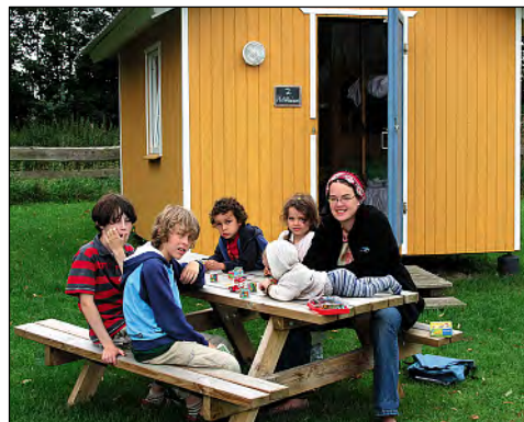
Fünf skandinavische Campinghütten mit Platz für bis zu 25 Personen und richtigen Betten finden viel Interesse.